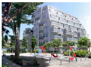
THEパームス三鷹レジェーロ

◆住宅エコポイント対象住宅「THEパームス三鷹レジェーロ」では、屋上菜園やカーシェアリングを導入しました。 ◆CASBEE(キャスビー)Aランク認証取得オフィスビルの開発のほか、新築・既存問わず屋上緑化を推進しています。