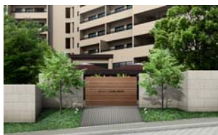
ヒルトップゲート