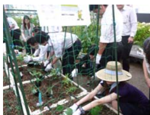
本社ビル屋上菜園