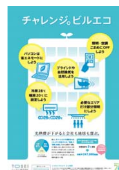
テナント啓蒙活動