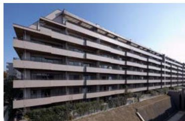
ヒルトップ横濱根岸

◆トーセイの中古マンション再生手法であるRestyling事業。建物を壊して新築するスクラップ&ビルドに比べ、解体や建設にかかる廃棄物やCO2の排出量を大幅に低減します。バリューアップ時には、環境商品の導入や緑化を積極的に推進しています。