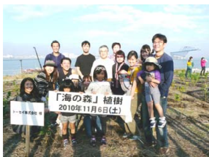
東京都海の森 植樹活動

◆社員と家族が参加する植樹活動や、自社ビル屋上菜園の運営のほか、「クール・ビズ、ウォーム・ビズ」の推進、リユース文具活用などを社内で環境活動を推進しています。その他所有ビルのテナントに対して環境啓蒙活動を推進しています。