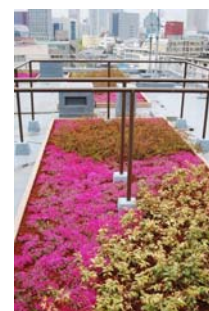
既存ビル屋上緑化