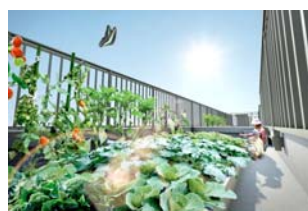
入居者専用屋上菜園