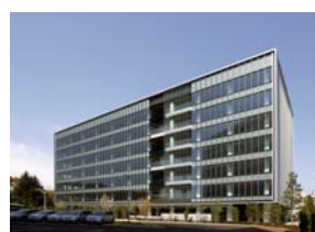
平和島トーセイビル