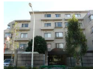
エステージ上野毛