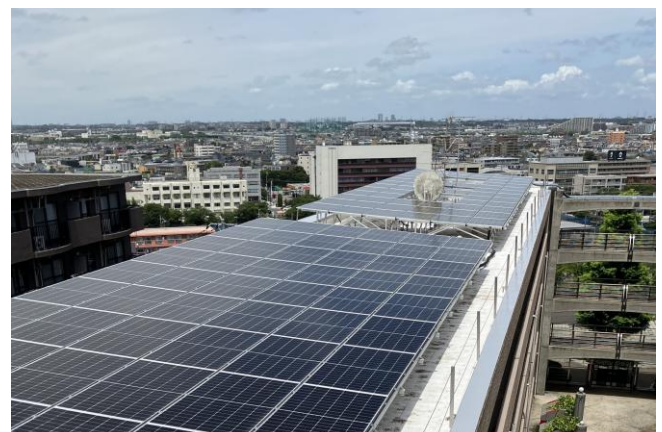
屋上に設置された太陽光パネル(全325枚)