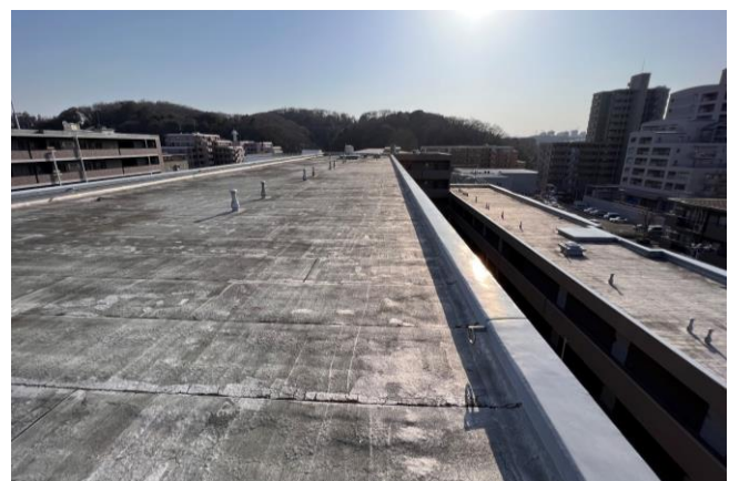
太陽光発電設備導入予定の屋上