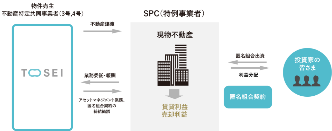
「トーセイ不動産クラウド TREC FUNDING」スキームイメージ